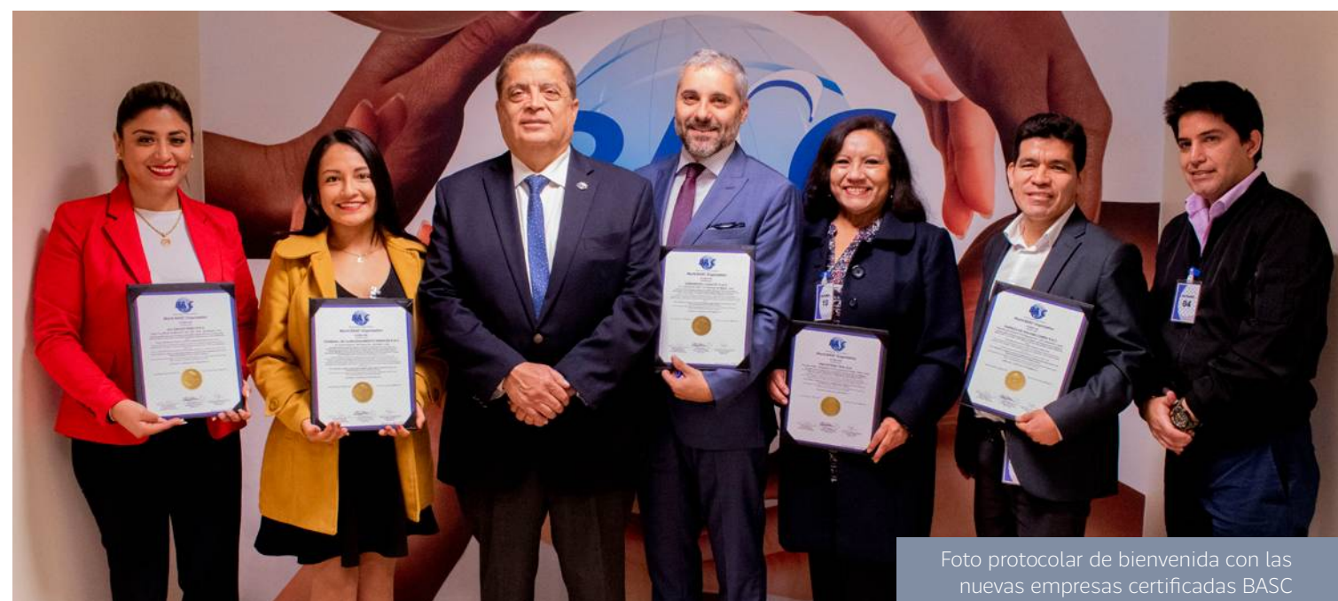
Foto protocolar de bienvenida con las nuevas empresas certificadas BASC