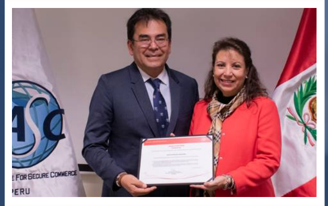
Acreditación como Licenciario de la Marca País por PROMPERÚ