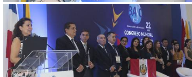
Discurso de BASC PERÚ como sede del Congreso Mundial BASC 2021