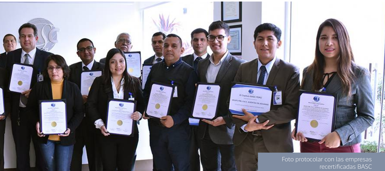
Foto protocolar con las empresas recertificadas BASC