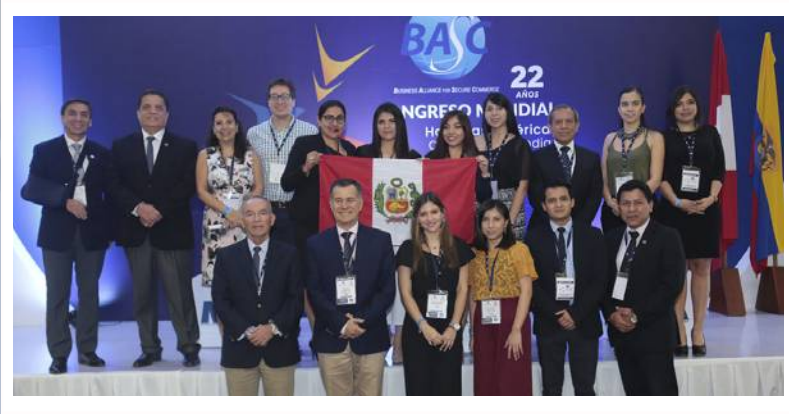
Organización del "IX Congreso Mundial BASC 2021" Lima - Perú