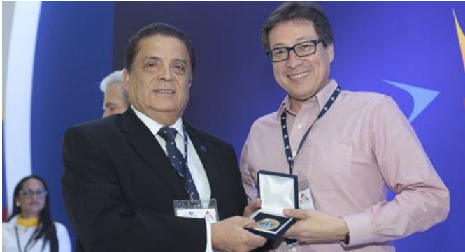
Reconocimiento a Talma Servicios Aeroportuarios