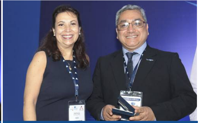
Representantes de BASC PERÚ y SUNAT (Perú)