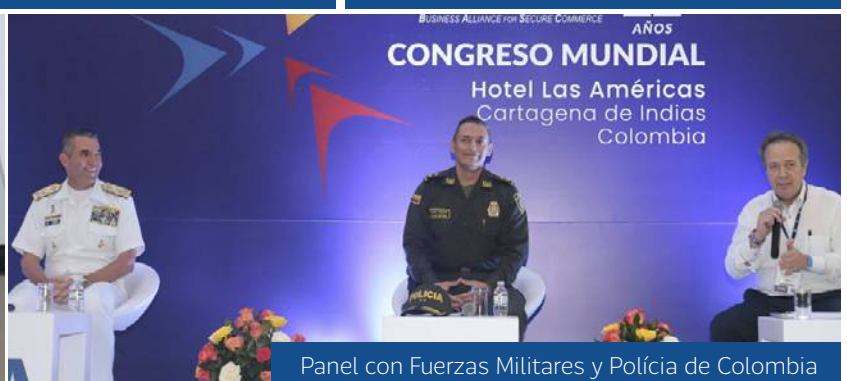
Panel con Fuerzas Militares y Policía de Colombia